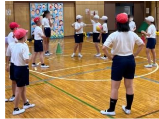
نقاش التلاميذ أثناء تحديد قواعد اللعبة (نادي الرياضة : دودجبول)