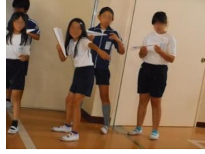
نادي الأعمال اليدوية (صناعة أشياء صغيرة)