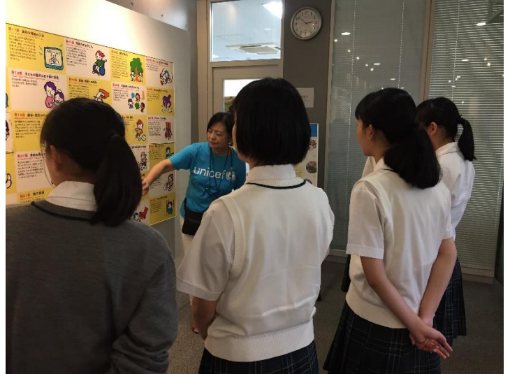
⑤ تنفيذ ورشة العمل واستعراض اللوحات والملصقات الخاصة بالبحث قامت كل مجموعة بتعليق الصور والملصقات الخاصة بالبحث واستعراضها أمام الحضور